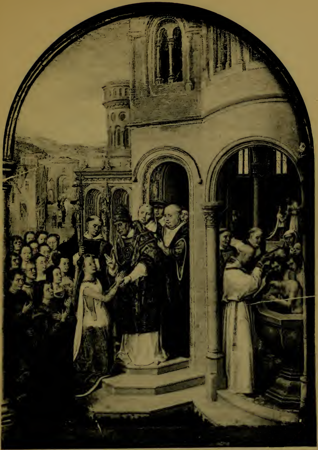
L'Arrivée à Rome Troisième panneau de la Châsse de Ste-Ursule.